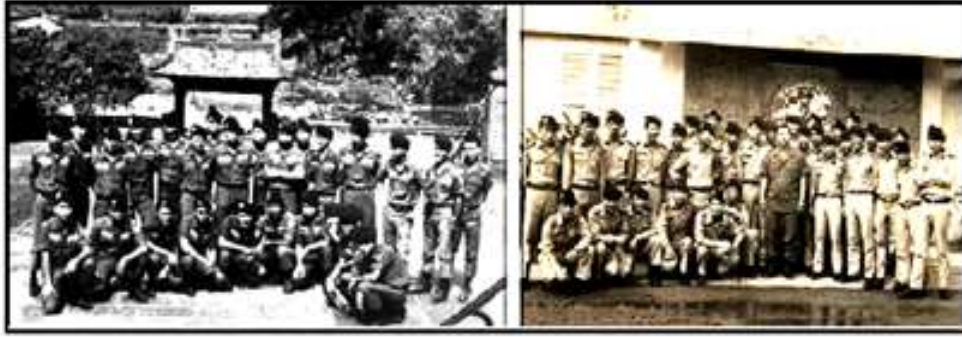
K26 và K29 công tác CTCT tại Huế