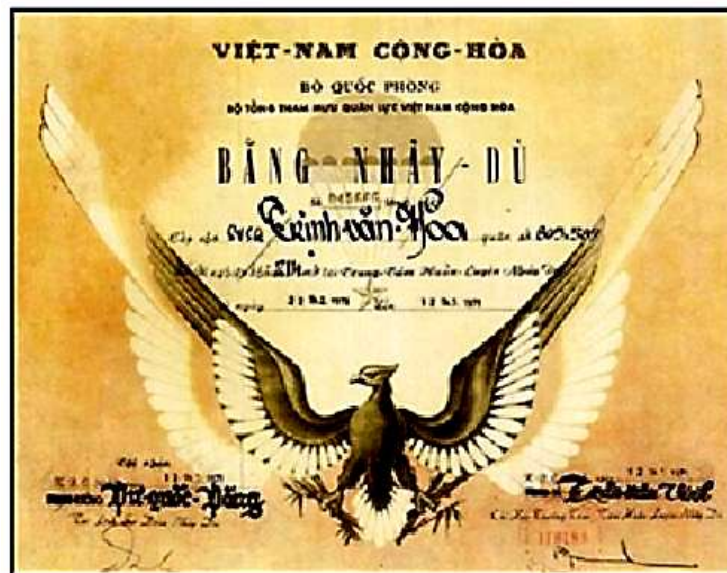
Bằng Nhảy Dù Khóa 214

Trong năm thứ ba, 32 SVSQ chọn HQ và 30 SVSQ chọn KQ được theo học chuyên nghiệp tại Nha Trang. Trong khi đó, SVSQ Lục Quân theo học Khóa 214 Nhảy Dù tại Sài Gòn.