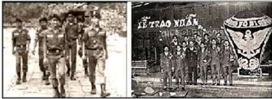
Công tác CTCT tại QK1

Cũng do công tác CTCT, chương trình du hành thăm viếng của Khóa 28 được hủy bỏ. Thay vào đó là học quân sự xen kẽ với văn hóa của năm thứ hai.