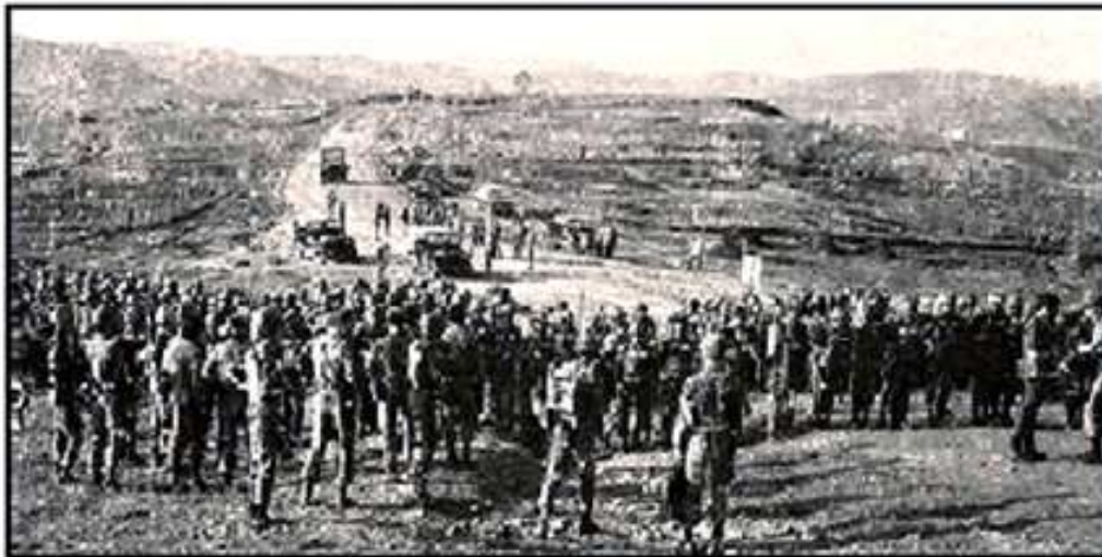
TKS/K31 trên đường chinh phục Lâm Viên

- Chinh Phục Đỉnh Lâm Viên Ngày 15/03/1975.