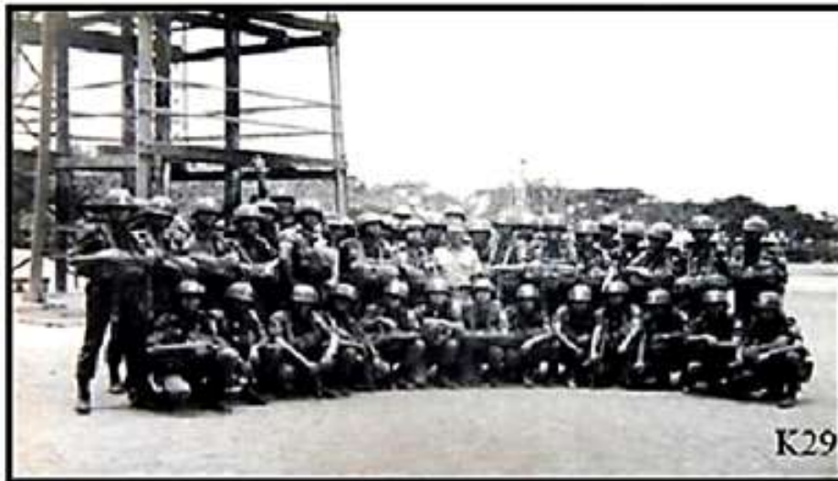
Thụ huấn Khóa Nhảy Dù tại Trại Hoàng Hoa Thám - Sài Gòn

SVSQ Lục Quân Khóa 29 tham dự khóa học ND tại trại Hoàng Hoa Thám, Sài Gòn, cùng với SVSQ TĐ1/Khóa 28. SVSQ/Khóa 29 chia thành 2 toán theo học 2 khóa ND 360A và 360B. Mới học được 2 tuần, bị đình hoãn. Tất cả SVSQ trở về Trường.