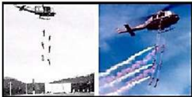
K26 biểu diễn viễn thám trong Lễ Mãn Khóa 24