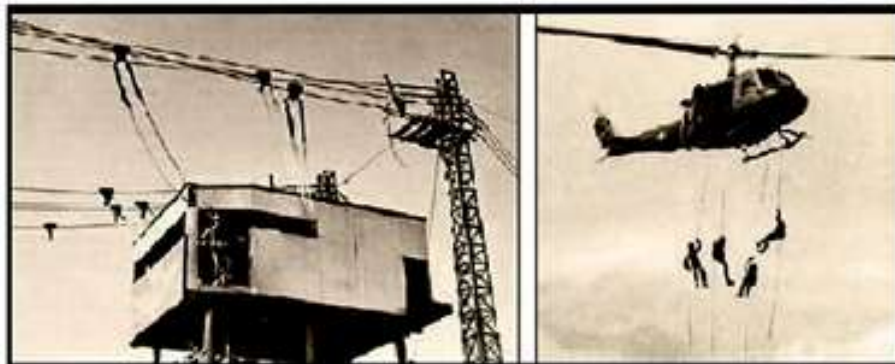
Thực tập Nhảy Dù

Đợt 2: TĐ1 huấn luyện TKS, TĐ2 học Khóa 332 ND trong tháng 03/1974.