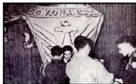
Lễ Trao Nhẫn K25