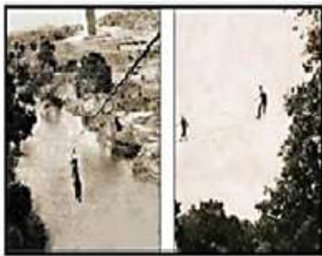
K26 thực tập tại TTHL/BĐQ

8 SVSQ Khóa 26 biểu diễn tuột dây và leo thang (Hình thức thả Viễn Thám).